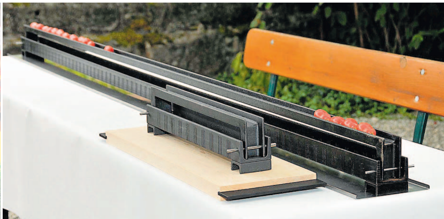
Edel und pfiffig: Der Tischgrill der dänischen Marke Eva Solo (li.). Extra für Biertischgarnituren hat Isabelle Enders aus Nürnberg ihren ungewöhnlich schmalen Tischgrill (re.) entworfen.