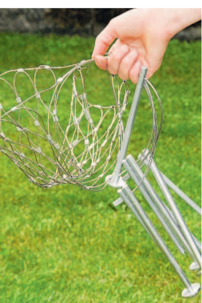
Praktisch: So klein und handlich lässt sich das Grillnetz, das man auf dem Foto oben rechts im ausgebreiteten, quasi einsatzbereitem Zustand sieht, zusammenlegen.