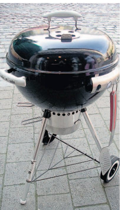
Klassiker der gehobenen Grill-Kultur: Ein typischer Weber-Grill.